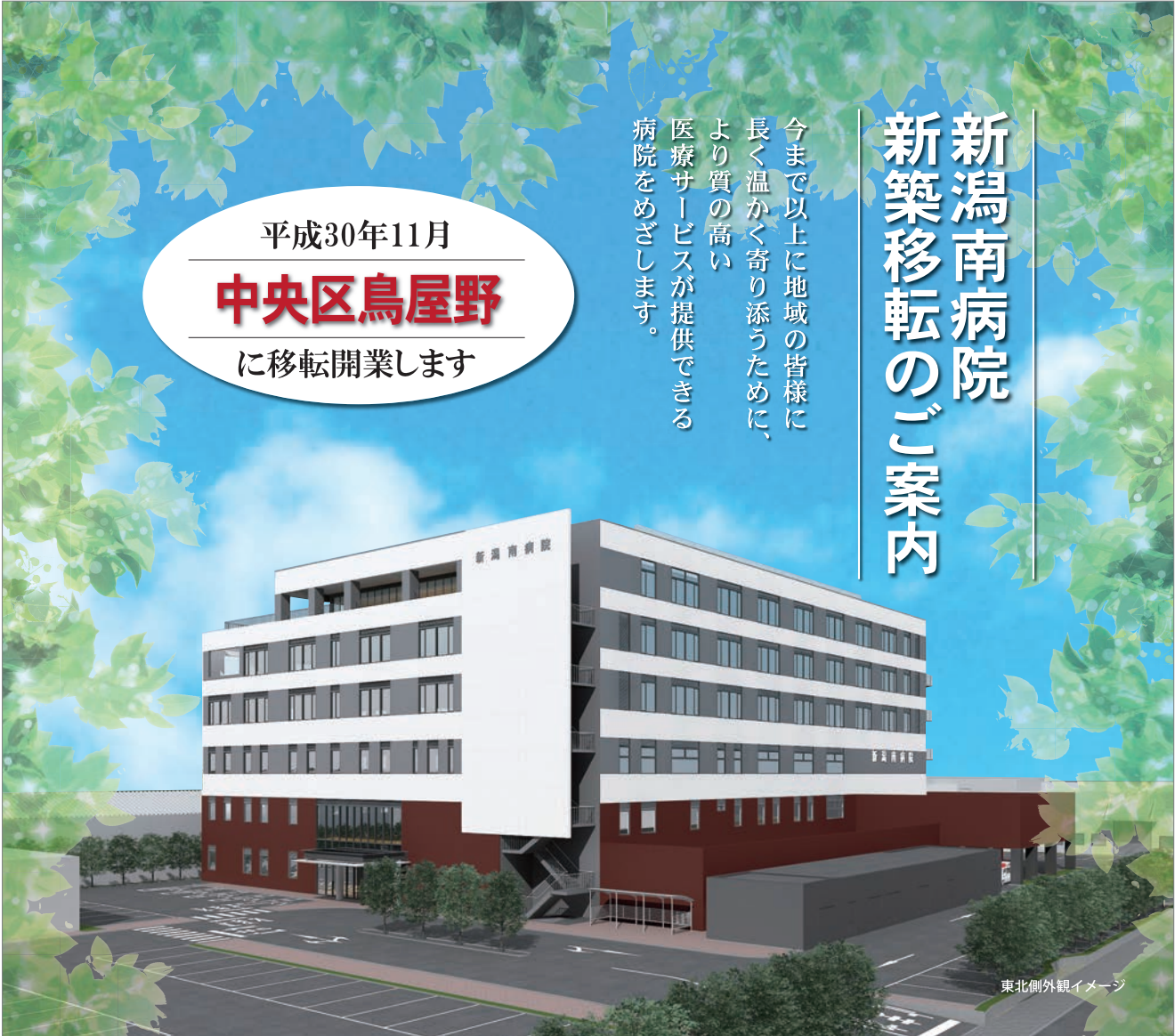
東北側外観イメージ